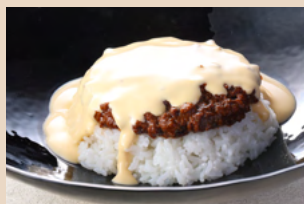
スパイス香るチーズキーマカレー

※おこしやす大使コラボメニューはコースタープレゼント対象外です。※コースターは各種無くなり次第配布終了となります。