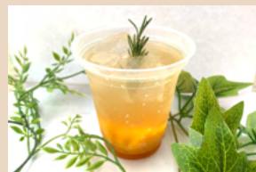
フルーツティーソーダ (オリエンタル・アイスワイン・アップルガーデン)