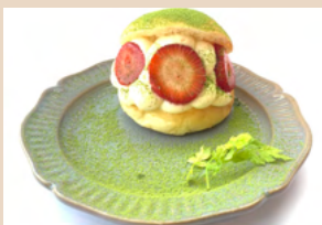
マリトッツォ抹茶カスタード