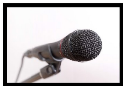
ダイナミックマイク コンデンサーマイク

種類も豊富にあるため、楽器店や家電量販店で、予算に見合うレベルの物をそろえる必要があります。買ってすぐ使いこなせるものでもないの、十分に調査したうえで買しましょう。下記に一例を示します。